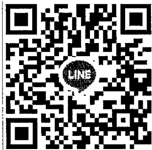
QR-Code กลุ่ม Line “บวชถวายวปร.-สก. ปี๖๖”